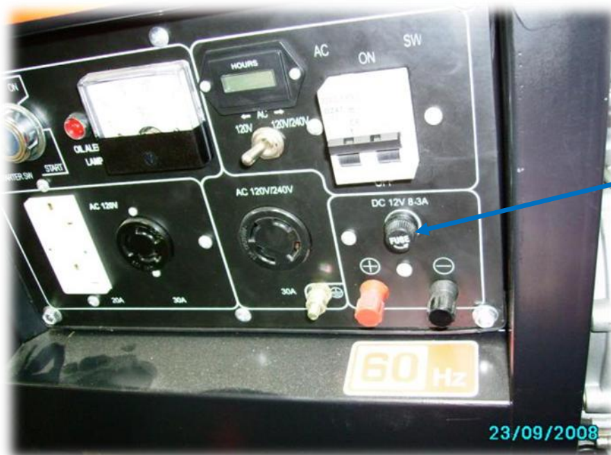
Fusível do carregador de baterias